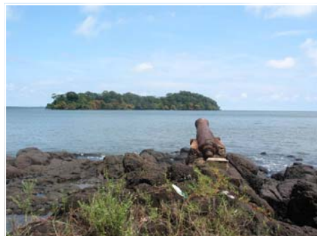
La beauté naturelle des sites