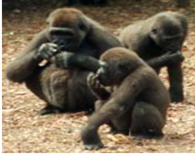
Protéger les animaux