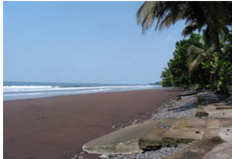
Plage de kribi